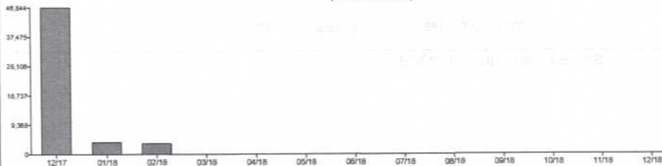
Comportamiento del Valor del Patrimonio a V.Mercado (miles de Pesos)